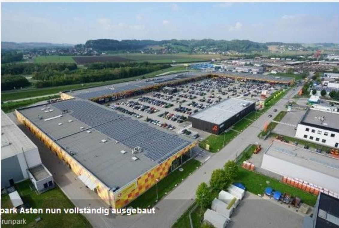
Frunpark Asten nun vollständig ausgebaut